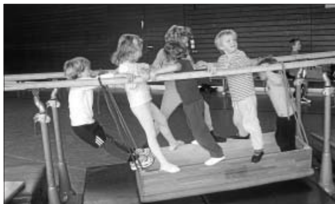
Der Spaß stand allen ins Gesicht geschrieben und keine Aufgabe schien zu schwer, als dass sie nicht zu lösen gewesen wäre.

Karten können in den großen Pausen oder im Sekretariat für 6 € gekauft werden. Über www.pmhg.de lassen sich auch Plätze im Internet reservieren.