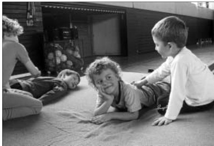
Nach so vielen Herausforderungen darf die Entspannung am Ende natürlich nicht fehlen. Mit einer phantasievollen Partnerübung erholten sich alle sehr schnell und gingen glücklich und zufrieden von Deck.

Vielen Dank an alle Beteiligten des Auf- und Abbaus - und natürlich an Uli, die wieder viele tolle Ideen in den Stationen eingebracht hat!