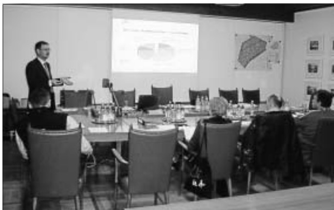
Ehrenamtliche und Hauptamtliche beteiligen sich am Energiezertifikat im Energieteam

Am 10. März 2010 findet die nächste Sitzung des Energieteams statt. Im Mittelpunkt der Arbeit steht dann der Maßnahmenkatalog mit seinen 89 Fragen und Themenfeldern.