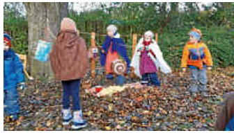
Der Igel Kokosnuss und seine Freunde.

So ging ein spannender, leuchtender Tag zu Ende. Ich bin schon ganz neugierig, was wir als Nächstes im Wald erleben werden. Bis ganz bald – euer kleiner Waldwusler