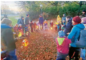
Ich geh' mit meiner Laterne ....