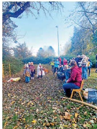
Unser Theaterstück - ein voller Erfolg