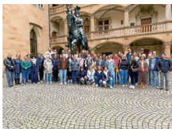
Die Kocheltern beim Mensafest