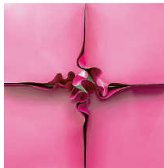
Kirstin Arndt, Ohne Titel, 2015, Copyright: VG Bild-Kunst, Bonn 2026,