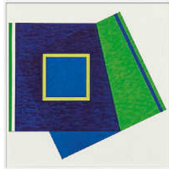
Marguerite Hersberger, Windows Pliage Nr. 149, 2019/20, Copyright: Künstlerin, Foto: Peter Schälchli

Die Teilnahme ist kostenfrei, bis auf den Museumseintritt.