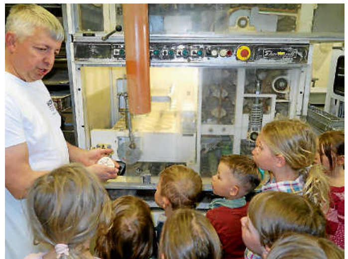
Wie werden eigentlich Brötchen gemacht?

Heute erzähle ich euch von einem richtig leckeren Abenteuer. Wir waren nämlich zu Besuch in der Bäckerei Bauer in Steinenbronn. Schon an der Tür hat es so gut nach frischen Brötchen gerochen, dass mein Bauch gleich Hunger bekommen hat!