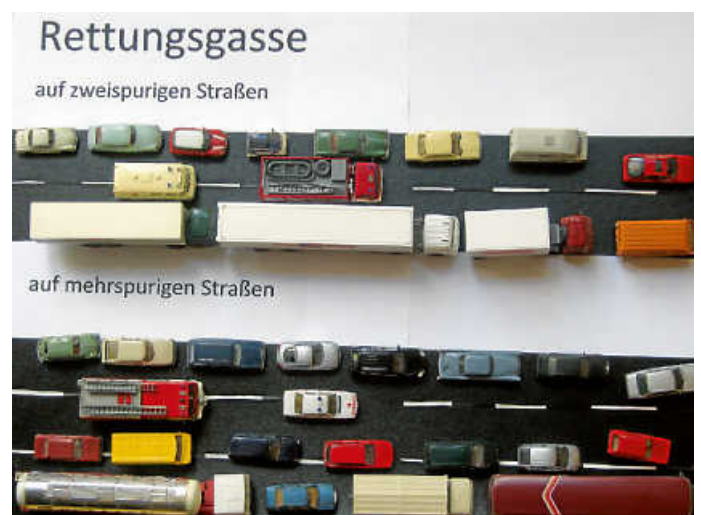
Grafik: Feuerwehr Waldenbuch Fortsetzung auf Seite 4

In der Straßenverkehrsordnung ist seit den 1980er-Jahren geregelt, dass bei Stau und stockendem Verkehr auf Autobahnen in Deutschland eine Rettungsgasse gebildet werden muss; die gesetzliche Regelung und die Strafen hierfür wurden aufgrund vieler Vorfälle, gerade mit Gaffern, verschärft. Die Gründe liegen auf der Hand: Die freie Spur schafft Einsatzkräften wie Polizei, Rettungsdienst, Feuerwehr, THW und Abschleppdiensten eine Zufahrt zur Unfallstelle, um so schnell wie möglich Leben zu retten, Verletzte zu versorgen und Brände löschen zu können. Weiterer positiver Aspekt: je schneller die Einsatzkräfte vor Ort sind, desto schneller können auch die Straßensperrungen und Staus aufgelöst werden.