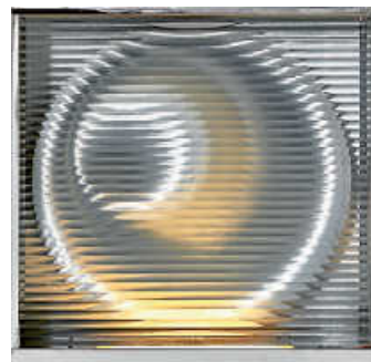
Foto: Heinz Mack, Silber-Mond-Rotor, 1971 © VG Bild-Kunst, Bonn 2025

Glanzstücke. Lichtkunst aus der Sammlung