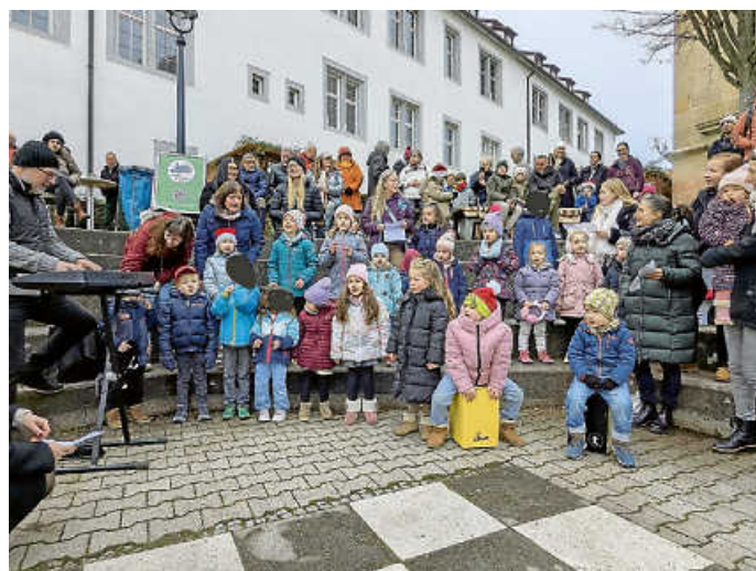
Weihnachtsliedersingen zur Eröffnung durch die Kindergärten Mühlhalde und Glashütte

Stunden hinweg für beste Unterhaltung. Der Posaunenchor der evangelischen Kirche sowie der Musikverein Stadtkapelle Waldenbuch e. V. gestalteten weitere Konzerte auf dem Schachbrett. Die Musikschule lud zum gemeinsamen Weihnachtsliedersingen in der Kirche St. Veit ein und rundete den Abend mit einem stimmungsvollen Weihnachtskonzert in ihren eigenen Räumen ab.