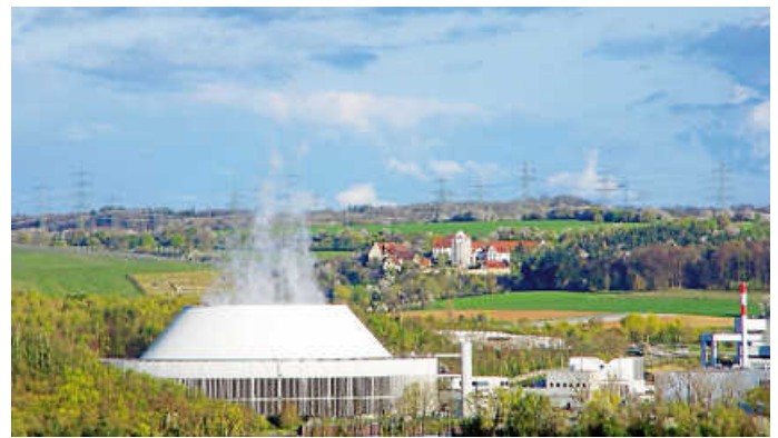
Die Dampffahne des Gemeinschaftskernkraftwerks Neckarwestheim II war stets von Weitem zu sehen.