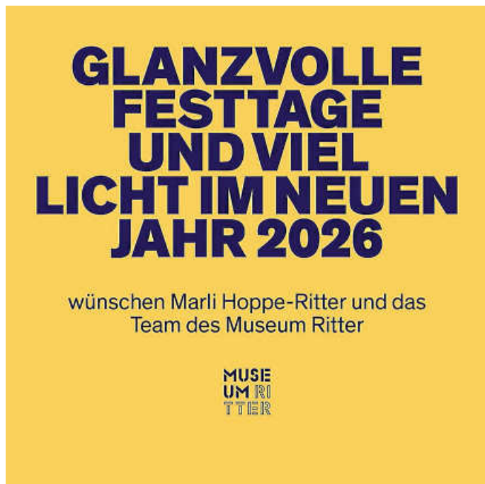
Foto: Weihnachtswünsche des Museum Ritter

Jeden Sonntag sowie am 2. Weihnachtstag, an Neujahr und am Dreikönigstag findet für alle interessierten Besucherinnen und Besucher eine kostenfreie öffentliche Führung durch die Ausstellungen statt. // Teilnahme im Museumseintritt inklusive