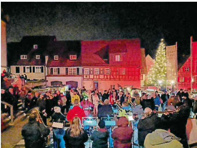
Weihnachtskonzert auf dem Schachbrett

An insgesamt 53 Ständen und in teilnehmenden Geschäften konnten die Besucherinnen und Besucher kulinarische Köstlichkeiten genießen, sich bei heißen Getränken aufwärmen oder noch das ein oder andere Weihnachtsgeschenk entdecken. Während der gesamten Marktdauer war der Weihnachtsmarkt sehr gut besucht; zeitweise gab es kaum ein Durchkommen. Das hohe Besucheraufkommen führte dazu, dass manche Stände bereits vor Marktschluss ausverkauft waren – ein deutliches Zeichen für den großen Erfolg des Jubiläumsmarktes.