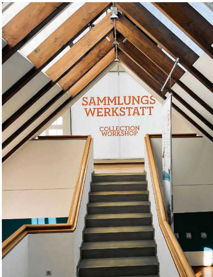
Neue Ausstellung in der Sammlungswerkstatt