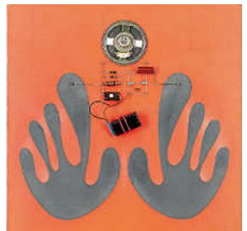
Foto: Walter Giers, Schwarze Hände, 1972 © Nachlass Walter Giers, Foto: Franz Wamhof