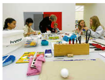
Kinder basteln im kimuri-Kunstatelier.

Inspiriert von einem Rundgang durch die Ausstellungen gestalten Kinder ab 7 Jahren eigene kleine Kunstwerke. // € 6, inkl. Material; Anmeldung erforderlich unter Tel. 07157 53511-40.