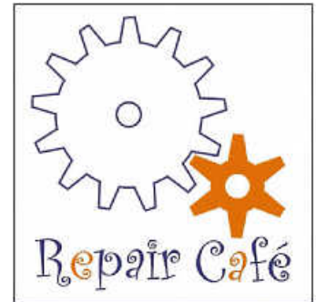
Logo: Walter Krämer

Die reparierten Gegenstände landen nicht auf dem Müll. Grundstoff- und Energiemenge, die für die Herstellung neuer Geräte benötigt würden, werden eingespart. Durch das gemeinsame Reparieren mit Fachkräften wird Wissen erworben, handwerkliche Fähigkeiten werden wieder geschätzt. Das Repair Café trägt zur Nachhaltigkeit in unserer Gesellschaft bei. Es ist außerdem ein guter Kommunikationsort.