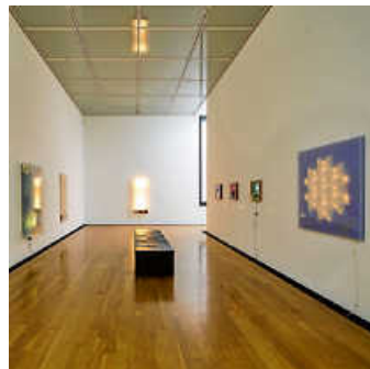
Ausstellungseinblick mit Werken von Walter Giers.