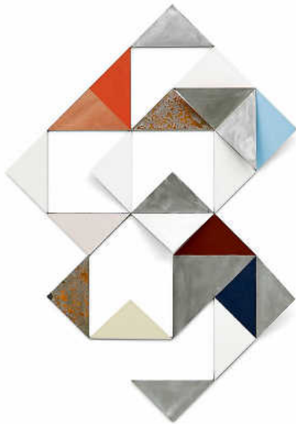
Henrik Eiben, Lush Life , 2015, Copyright: Künstler Foto: Ulrich Ghezzi