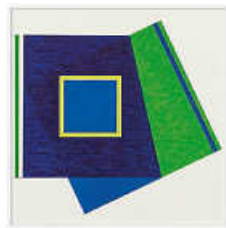
Marguerite Hersberger, Windows Pliage Nr. 149 , 2019/20, Copyright: Künstlerin

Anmeldung erbeten unter 07157 53511-40 oder an der Museumskasse.