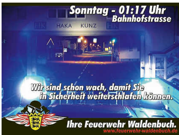
Plakat: Feuerwehr Waldenbuch

Dennoch gilt als Fazit des Artikels: Die Feuerwehr kommt lieber zehnmal zu früh als einmal zu spät! Scheuen Sie sich nicht und wählen Sie den Notruf 112 , wenn aus Ihrer Sicht ein Schadensereignis, wie ein Brand oder ein Unfall, vorliegt!