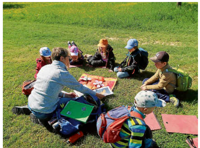
Bienenwissen auf der Wiese

Tschüss und bis bald, euer kleiner Waldwusler