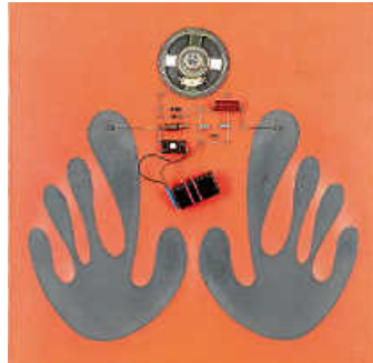
Foto: Walter Giers, Schwarze Hände, 1972 © Nachlass Walter Giers, Foto: Franz Wamhof