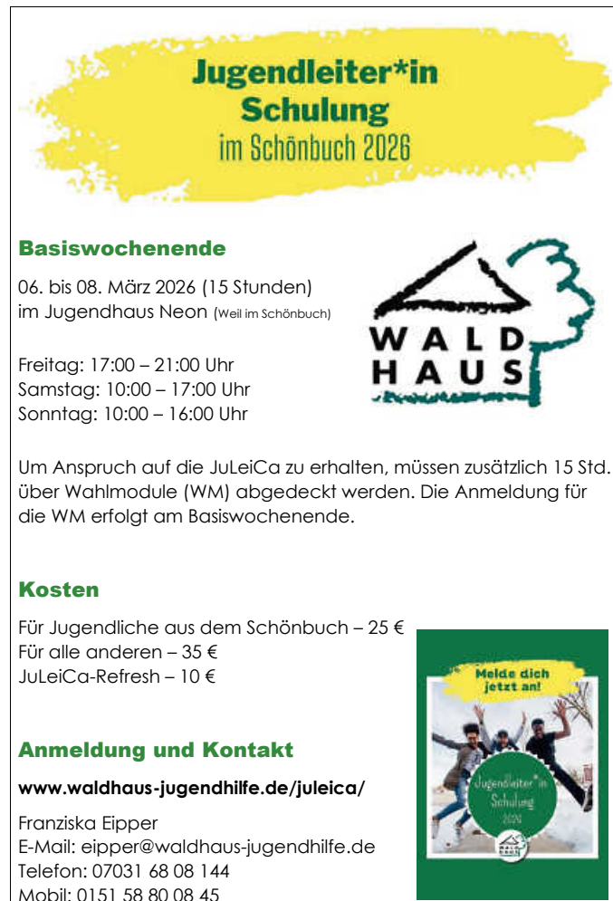
Plakat: Waldhaus-Jugendreferate Schönbuch