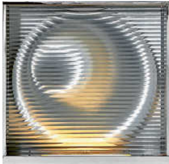
Foto: Walter Giers, Schwarze Hände, 1972 © Nachlass Walter Giers, Foto: ZKM | Zentrum für Kunst und Medien Karlsruhe; Franz Wamhof

Glanzstücke. Lichtkunst aus der Sammlung