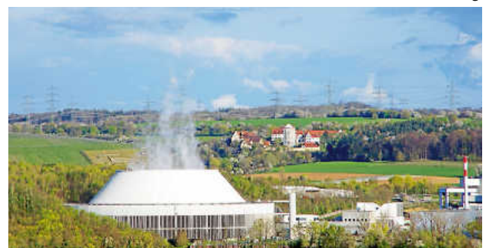
Die Dampffahne des Gemeinschaftskernkraftwerks Neckarwestheim II war stets von Weitem zu sehen.