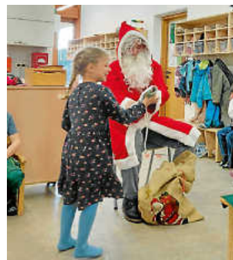
Besuch vom Nikolaus

Am Montag war bei uns im Kindergarten ein besonderer Gast, der Nikolaus! Schon bevor er zur Tür hereinkam, entdeckten die Kinder den roten Mantel. Aufgeregt liefen alle an die Tür und warteten ganz gespannt darauf, ihn zu begrüßen.