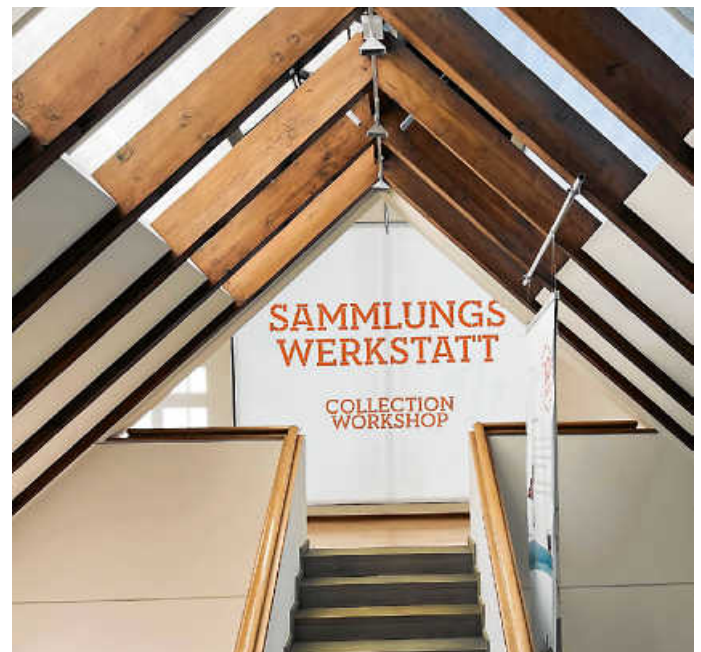
Neue Ausstellung in der Sammlungswerkstatt